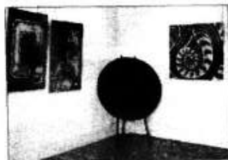
L'art abstrait sous toutes ses formes...